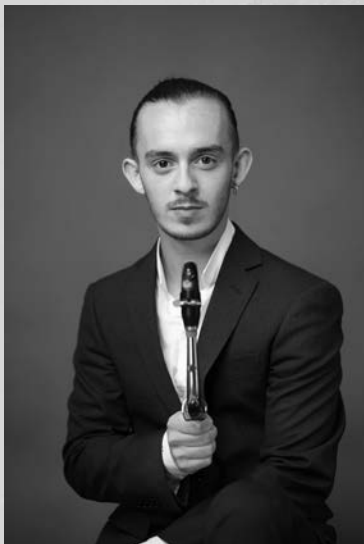
エティエンヌ・ブザール (アルト・サクソフォン)