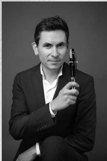
ヨアキム・シエスラ (バリトン・サクソフォン)